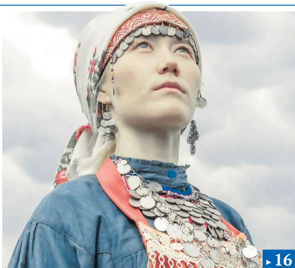
Кадр из фильма «Кыз»