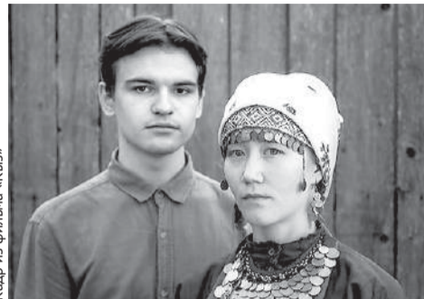
Кадр из фильма «Кыз»

В столице Удмуртии состоится мини-фестиваль короткометражного кино, связанного с темами культурных традиций народов России, этничности и её осознания. Большинство фильмов не длинее получаса, есть и совсем короткий метр. В первый день, 4 декабря, зрители увидят фильмы «Бог Дьё-сёгёй» (на якутском языке), «Горький мёд» (на башкирском языке), «Представь» (на татарском и русском языках). Программа стартует в 15.00. 5 декабря с 19.00 на мини-фесте фильмы «Антигона» (на кабардинском языке), «Дерево» (на ингушском языке), «Кыз» (на удмуртском и русском языках) и клип Shanu –Tevet на чувашском языке. 6 декабря с 19.00 программа включает фильмы «Сайти сын Зоули» (на ингушском языке), «Солдатская шапка» (на татарском, русском и белорусском языках), «Живой» (на кабардинском языке), «Осень» (на якутском языке), «Солаан» (на тувинском языке). Все фильмы сняты не раньше 2011 года.