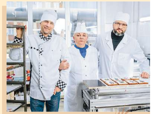
График по договоренности